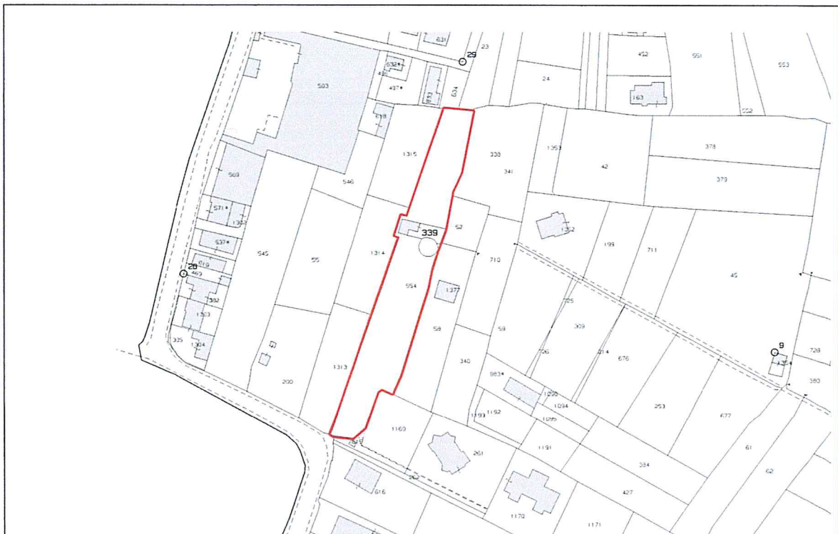
STRALCIO CATASTALE FOGLIO 8 PARTICELLE 339 e 554