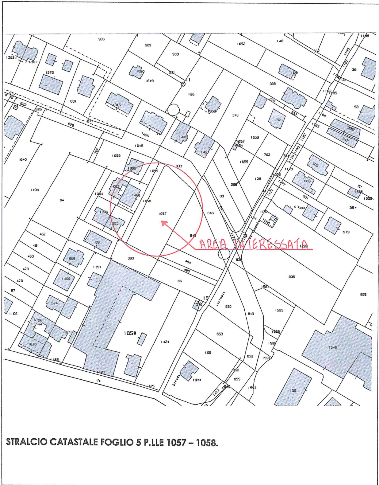
STRALCIO CATASTALE FOGLIO 5 P.LLE 1057 - 1058.