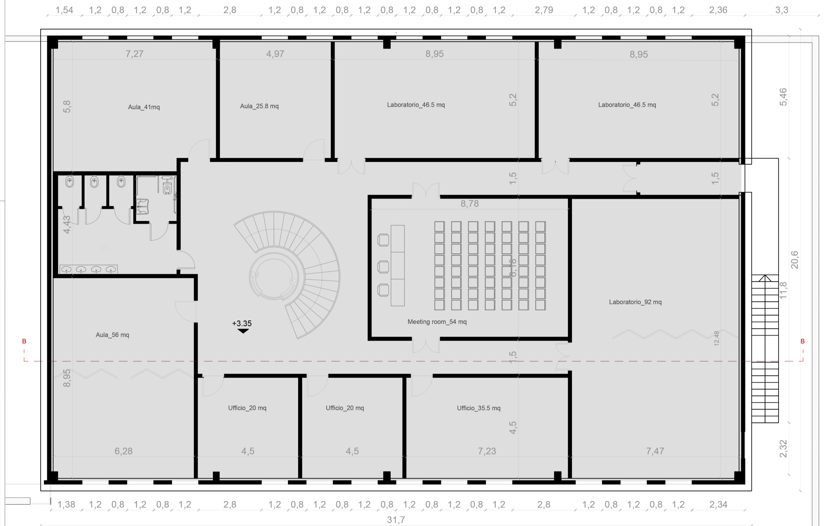
PIANTA PIANO RIALZATO _QUOTA +0.15 SCALA 1:100