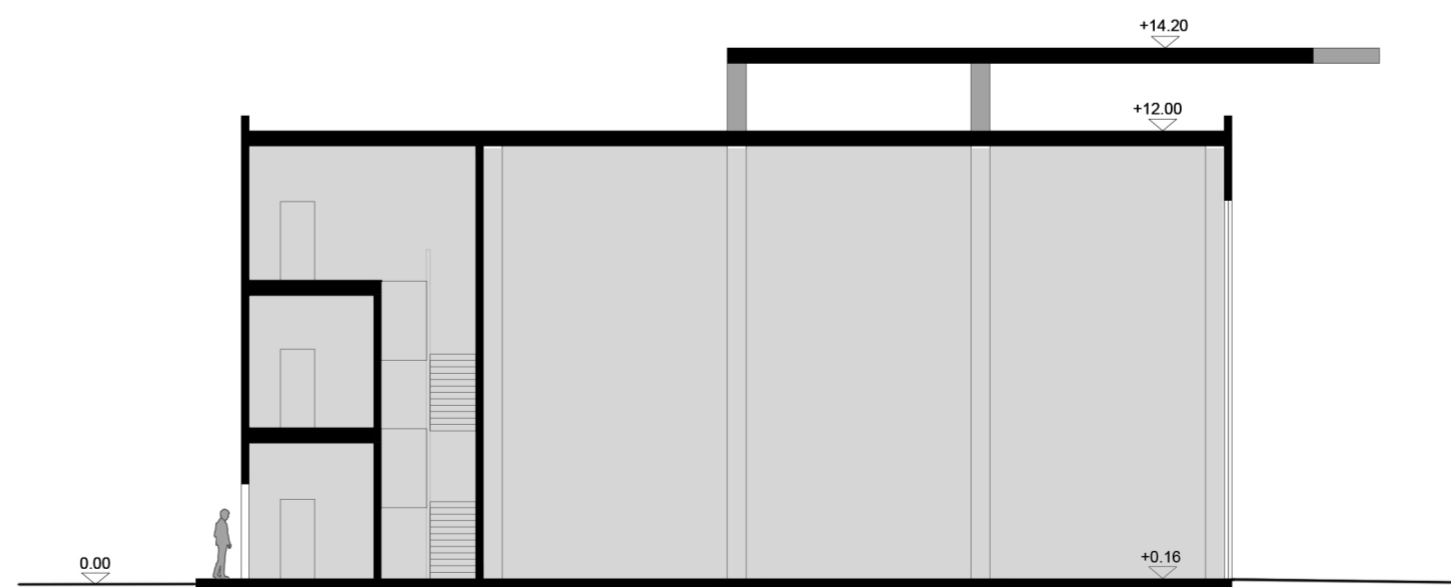
SEZIONE BB' _SCALA 1:200