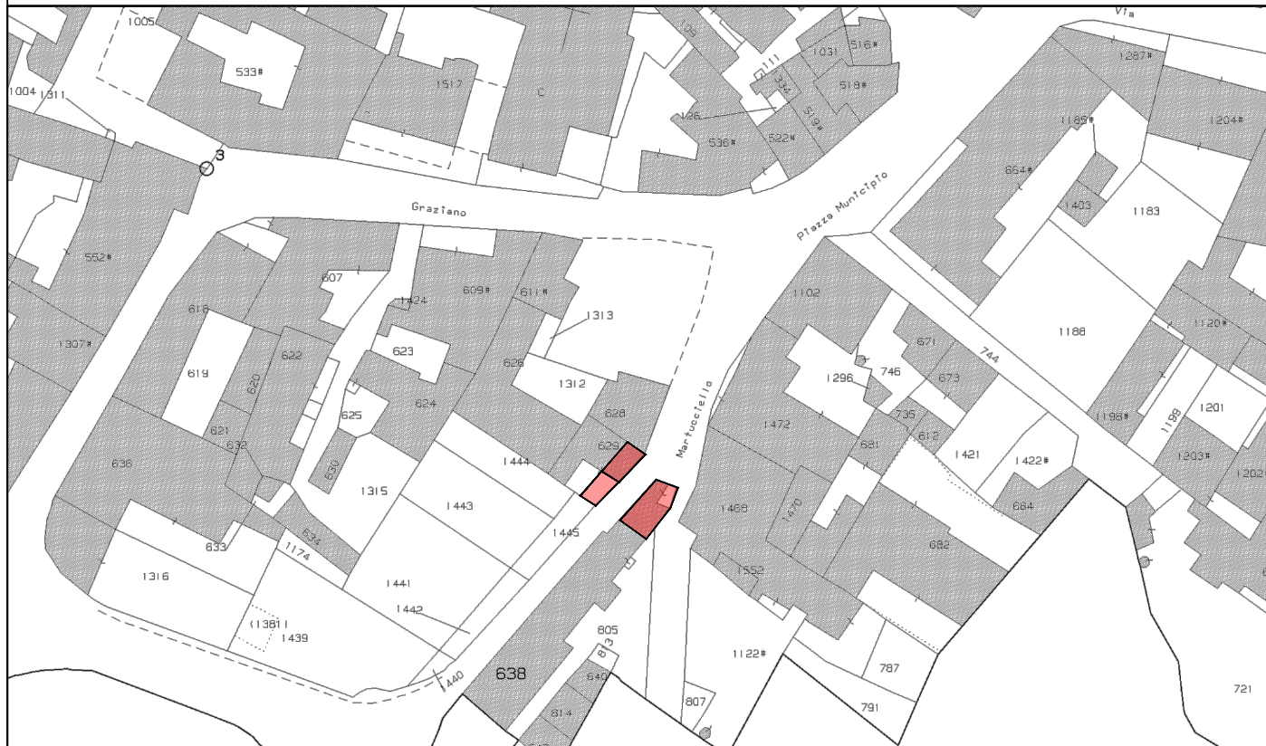
STRALCIO CATASTALE - scala 1:2000