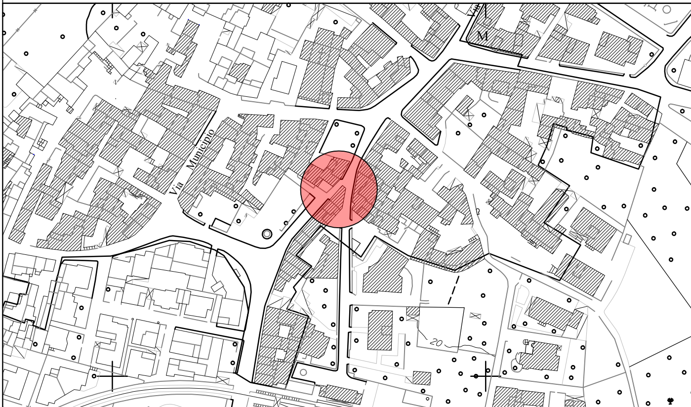
STRALCIO AEREOFOTOGRAMMETRICO - SCALA 1:2000